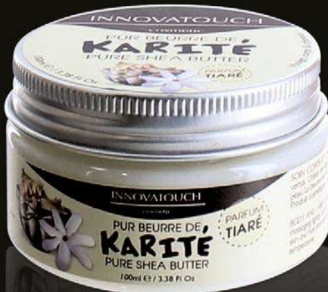
KARITÉ TIARÉ 100 ML