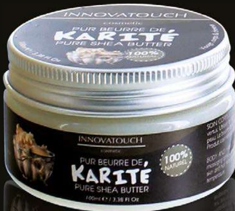
KARITÉ 100 ML