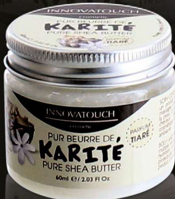
KARITÉ TIARÉ 60 ML