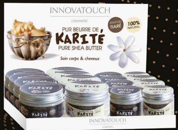
PLV comptoir Pur-Beurre de Karité