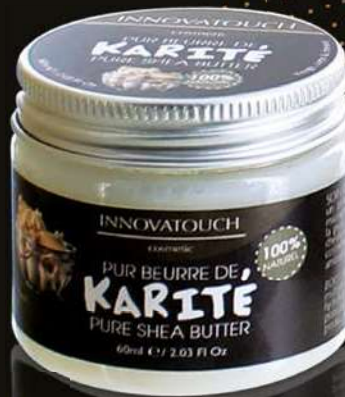
KARITÉ 60 ML