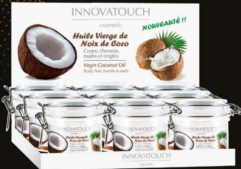
PLV comptoir Huile Vierge Noix de Coco